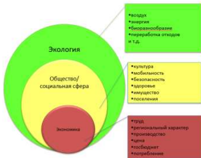
Модель сильной устойчивости развития

Благоприятная окружающая среда и рациональное использование природных ресурсов являются фундаментальным принципом модели сильного устойчивого развития, благодаря этому обеспечиваются основные условия для жизнедеятельности человека, биоразнообразия и возобновления природных ресурсов. Благоприятной является такая окружающая среда, качество которой обеспечивает устойчивое функционирование естественных экологических систем, природных и природно-антропогенных объектов.