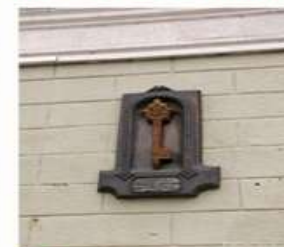
7. Ключ от города