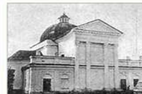
5. Костёл св. Казимира