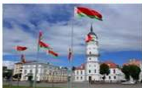
2. Площадь славы