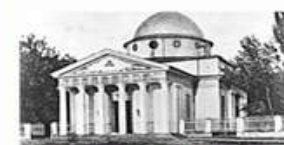
8. Собор св. Иосифа