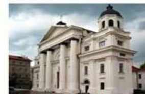
6. Костёл св. Станислава