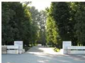
1. Могилевский замок