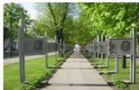
4. Аллея славы