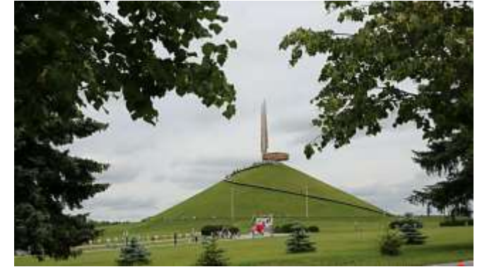
Мемориальный комплекс "Курган Славы"