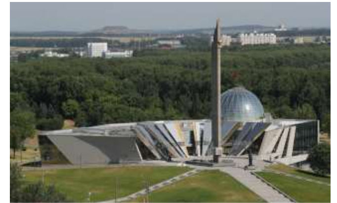
Музей истории Великой Отечественной войны