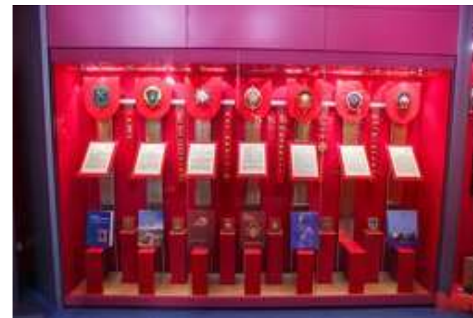
Музей современной белорусской государственности