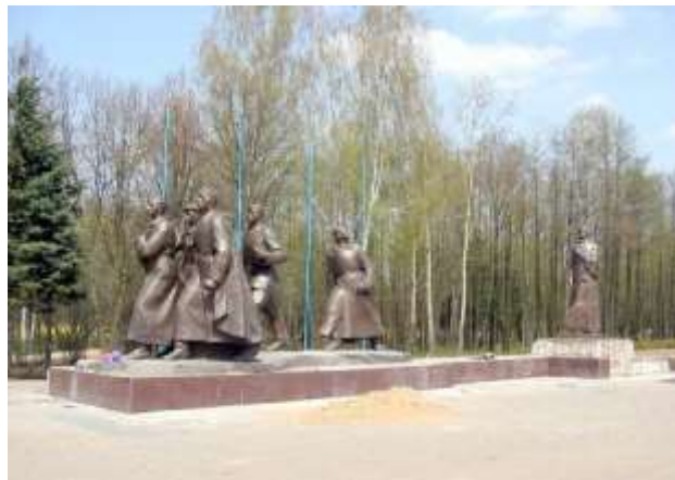
Монумент в честь советской матери-патриотки