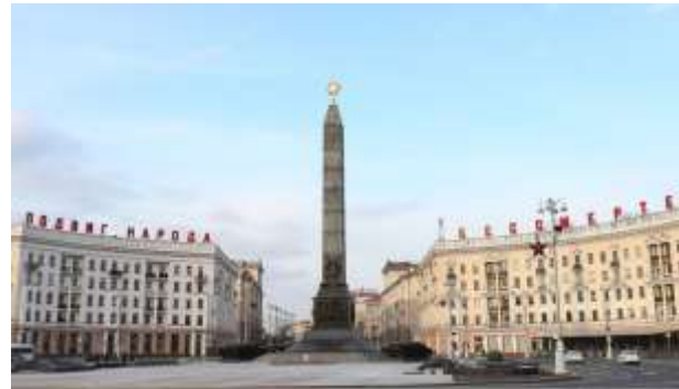
Площадь Победы в Минске