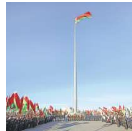
Площадь Государственного флага Республики Беларусь