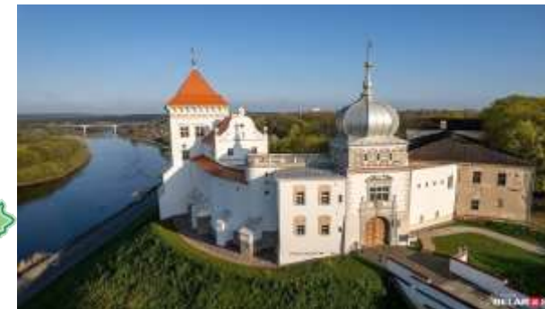
Старый замок в Гродно