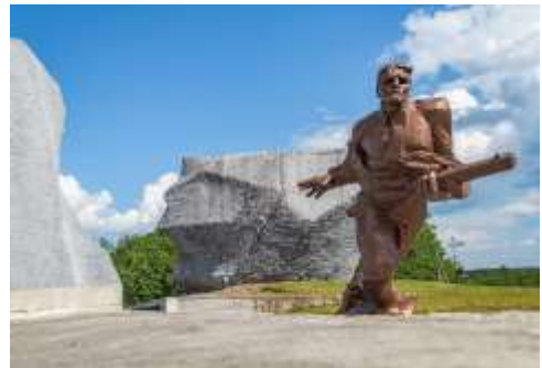
Мемориальный комплекс «Прорыв»