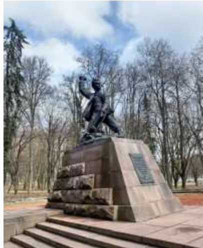
Памятник Марату Казею